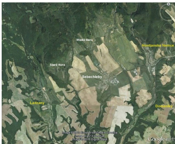
Obr. č. 2: Satelitný pohľad na obec Sebechleby