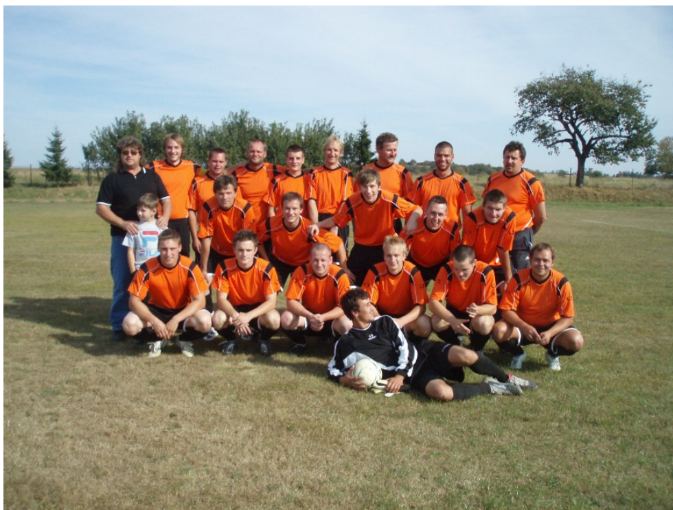
Obrázok 5: Futbalový klub OZ OFK Sebechleby